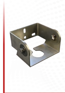
Soporte de 1,0"

El CNCR se puede montar utilizando un soporte de pared hecho de acero inoxidable que se extiende 3,25 u 8,0 pulgadas dentro del recipiente. El soporte de pared se ofrece con una abertura de 1,0 o 1,5 pulgadas. También está disponible un soporte de acero inoxidable para montaje en techo con una abertura de 1,5 pulgadas.