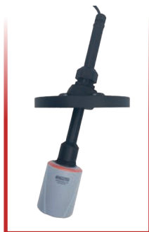
SWVL-15 (Extensión de 12")