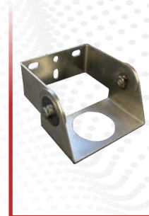
Soporte de 1,5"