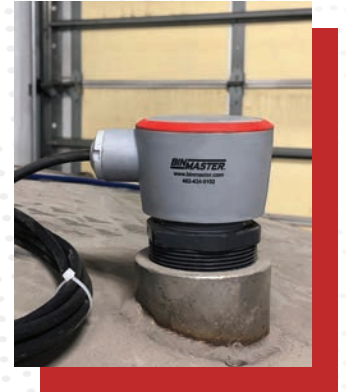
CNCR-130 instalado en un contenedor de fertilizante

Los sensores de nivel continuo también miden de forma fiable el exceso de polvo, humedad, vapor y no se ven afectados por el ruido. La tecnología de 80 GHz funciona con precisión si se produce condensación o acumulación moderada en la cara del sensor.